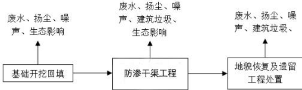
图 4-1 防渗干渠工程

根据调查，本工程施工期工艺流程与环评报告表中一致，工程施工可以分为渠道工程施工及渠道建筑物工程施工，具体工艺流程及产污环节如下图所示。